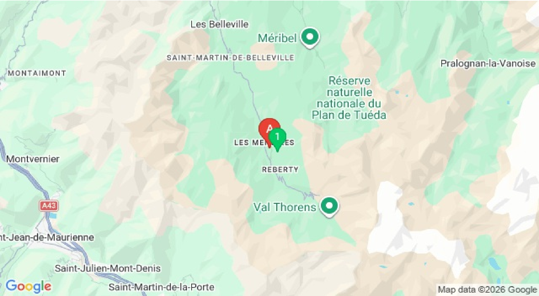
Map data ©2026 Google